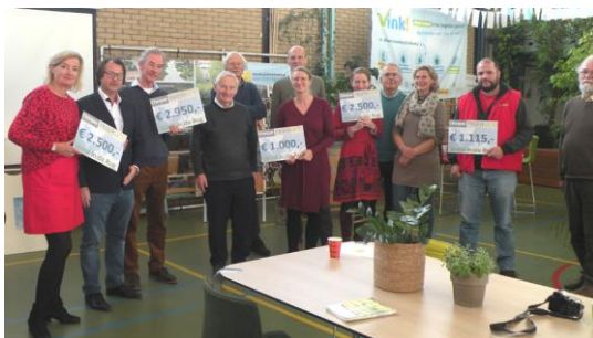
Groepsfoto met alle winnaars

Woensdag 20 november reikte de Coöperatieve Windenergievereniging Meerwind voor de vierde keer de jaarlijkse duurzaamheidsprijzen uit. Voor het project Wind in de Rug kunnen plannen van lokale organisaties en verenigingen, die willen investeren in energiebesparing, plaatsen van zonnepanelen, vergroenen van de omgeving etc., worden ingediend. Jaarlijks wordt een bedrag van € 10.000 beschikbaar gesteld, maar in de praktijk wordt er een veelvoud hiervan aangevraagd. Het bestuur van Meerwind moet de inzendingen dus beoordelen en een keuze maken. Voor 2019 was Stichting ZilverEsdoorn één van de prijswinnaars: 'voor het creëren van een duurzame biologische moestuin. De tuin wordt een ontmoetingsplek voor de buurt. Het geld wordt besteed aan ondersteuning bij de werkzaamheden van onze vrijwilligers. Het wordt een project vóór en dóór de buurt!'